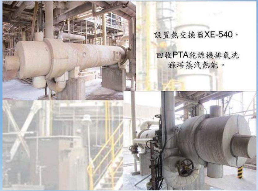
設置熱交換器XE-540， 回收PTA乾燥機排氣洗滌塔蒸汽熱能。