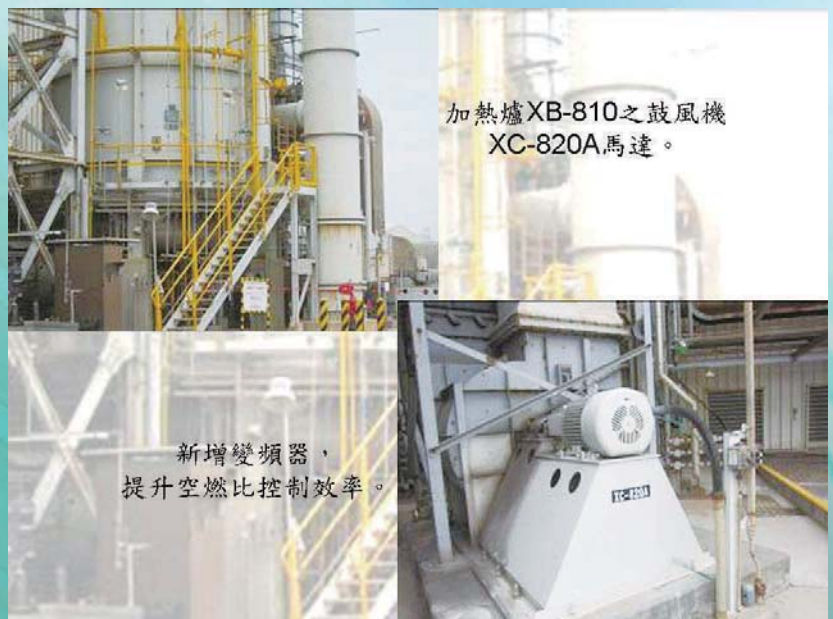
加熱爐XB-810之鼓風機 XC-820A馬達。