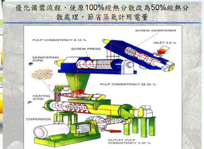
優化備漿流程，使原100%經熱分散改為50%經熱分散處理，節省蒸氣計用電量