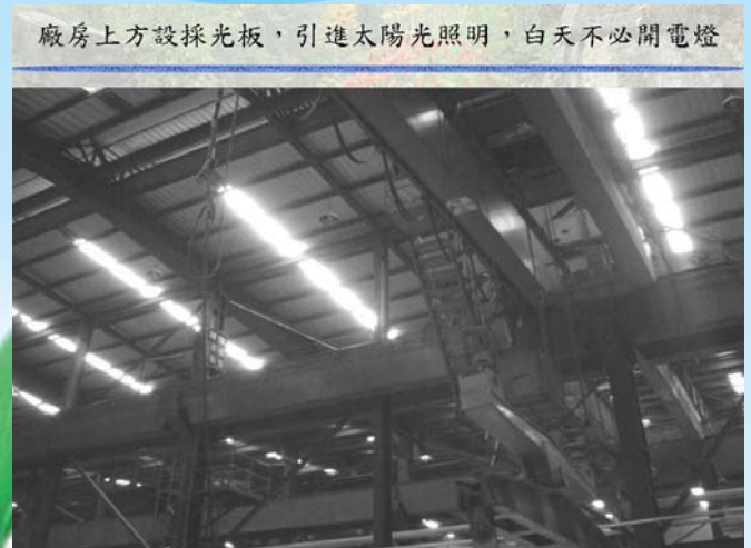
廠房上方設採光板，引進太陽光照明，白天不必開電燈