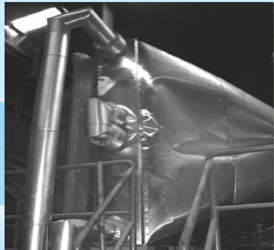
增設熱交換器回收廢熱來預熱新鮮空氣，降低蒸氣用量。