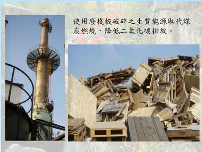
使用廢棧板破碎之生質能源取代煤炭燃燒，降低二氧化碳排放。